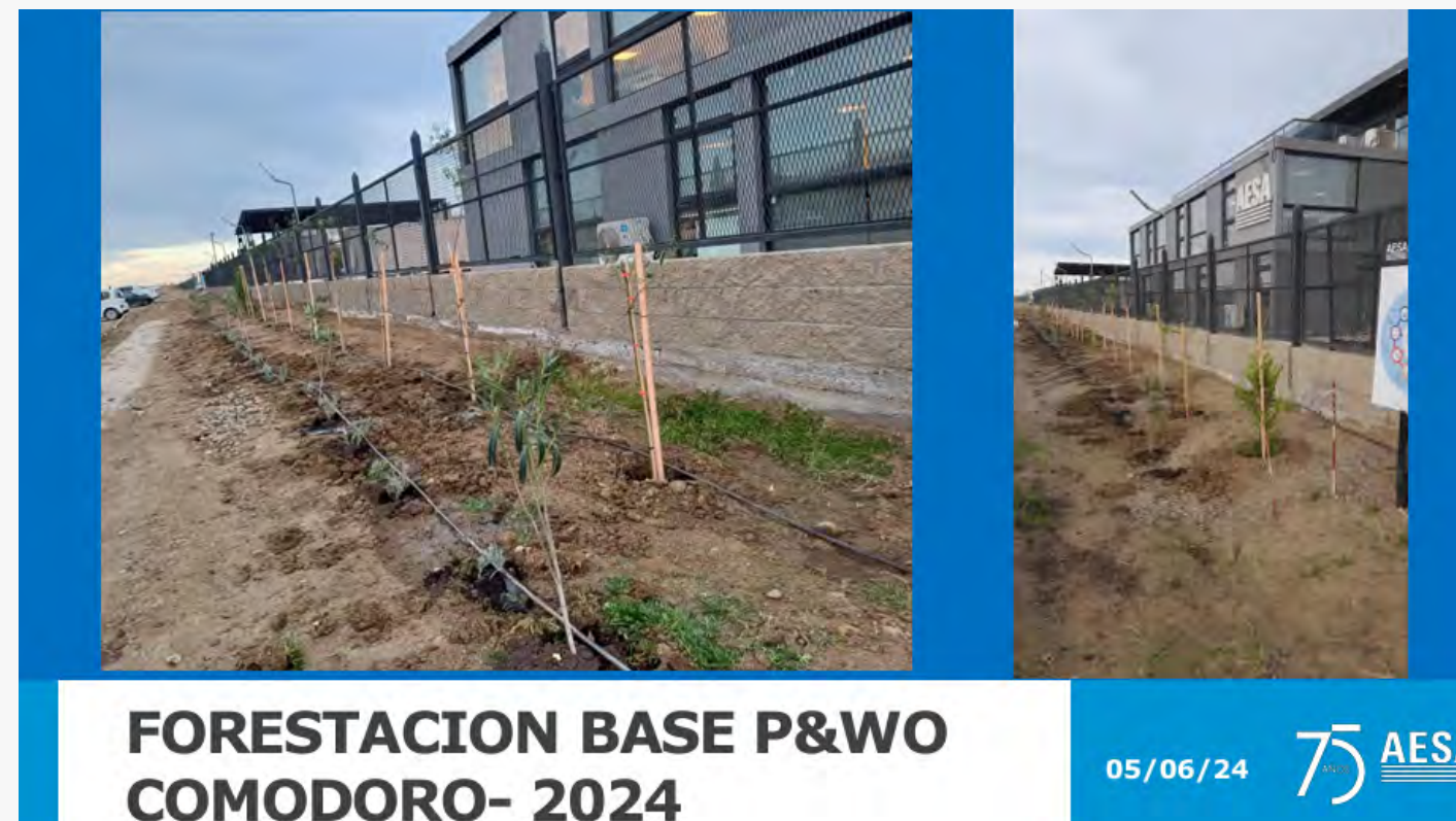
Forestacion Base P&Wo Comodoro-2024 (Archivo PDF)