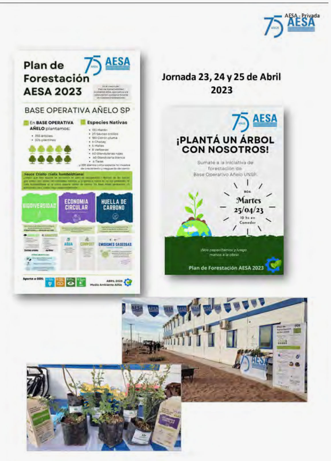
Jornada 23, 24 y 25 de Abril 2023 (Archivo PDF)