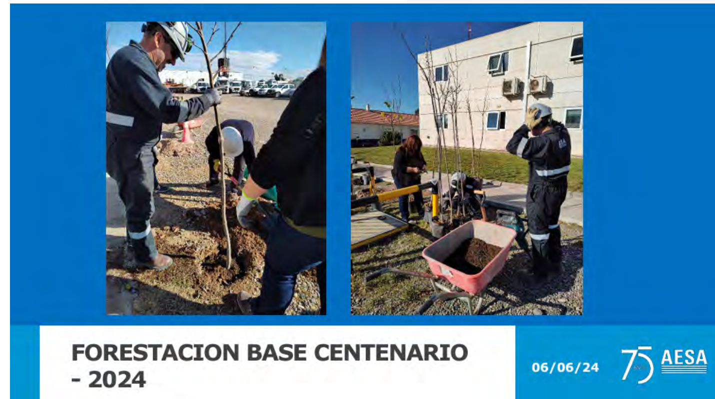
Forestacion Base Centenario- 2024 (Archivo PDF)