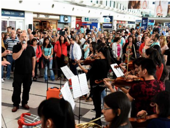
Concierto en Ezeiza junto a junto al reconocido tenor argentino Darío Volonté