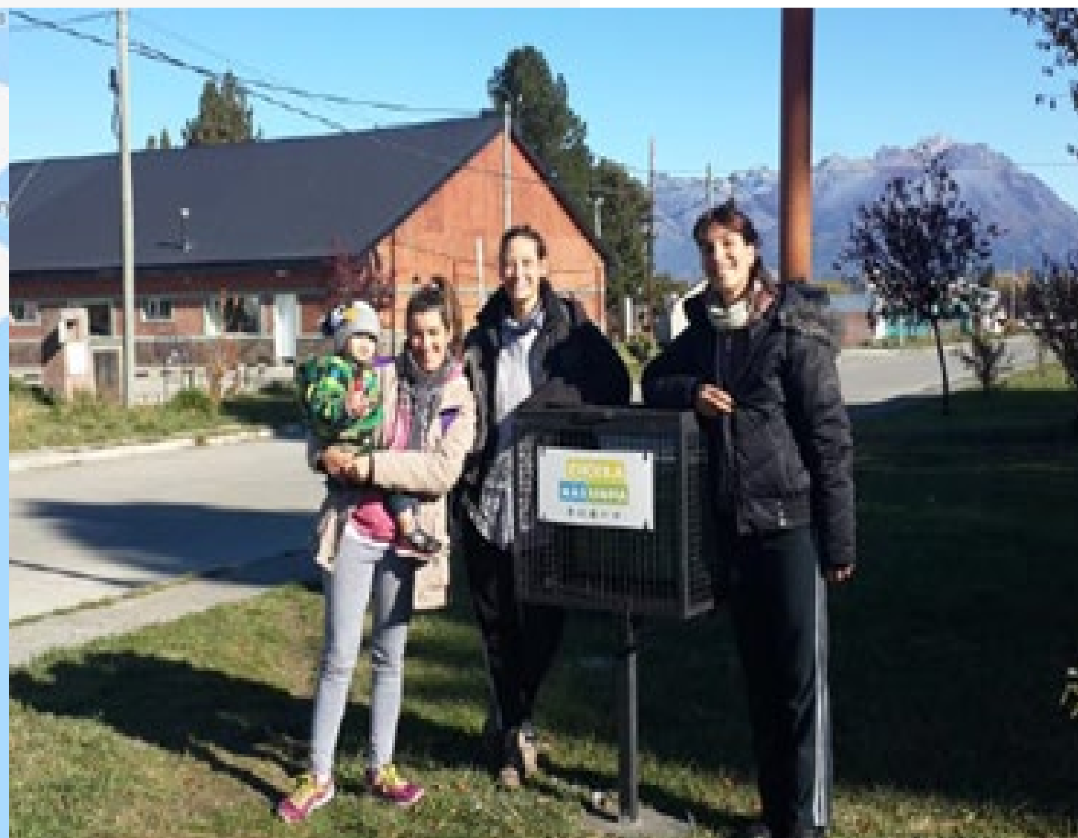
Entrega oficial de cestos para la localidad de Cholila en Esquel, con la cartelera de "Cholila más limpia" colocada junto a la Promotora Ambiental y vecinos.