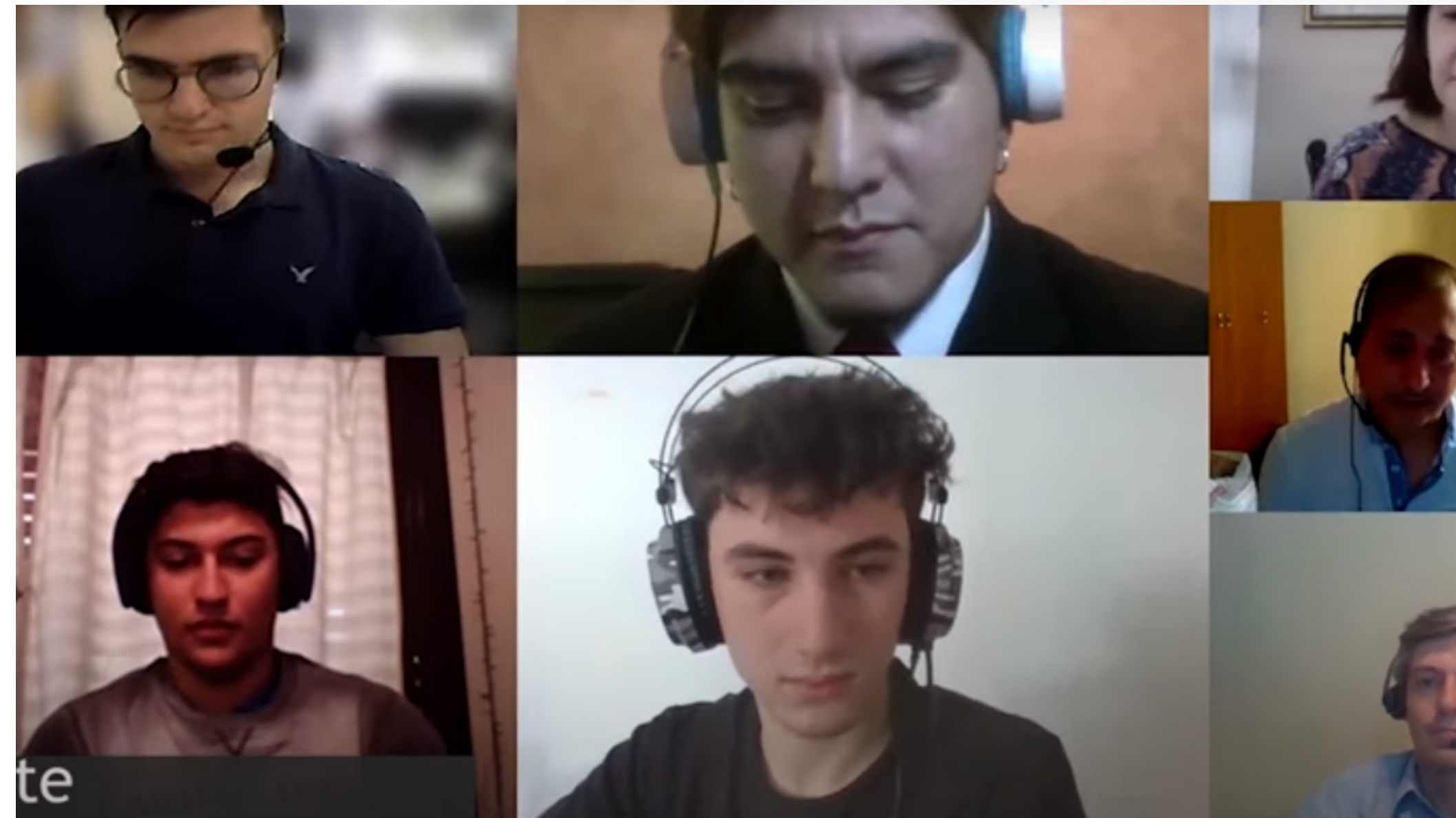
Video Cierre - Mentorías Mastellone (Video)