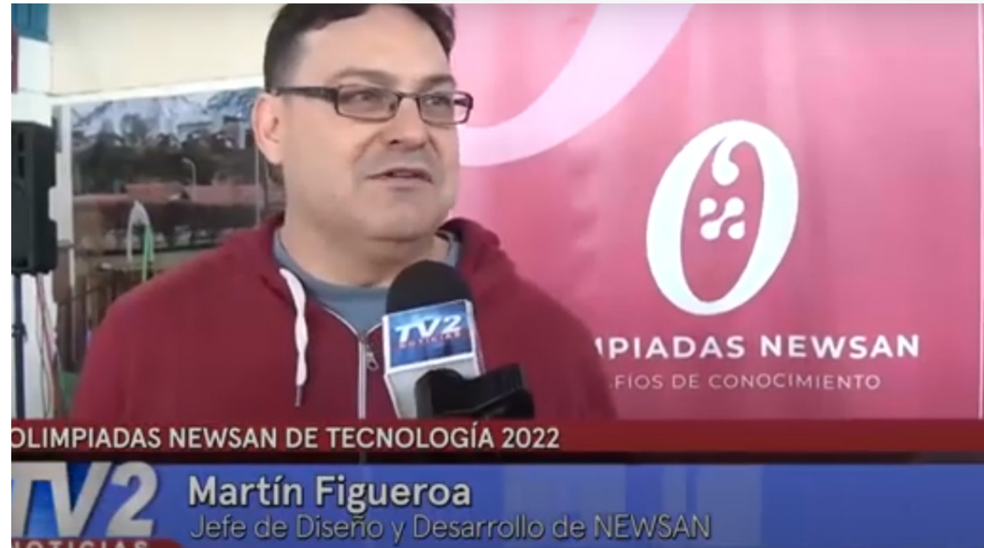
Olimpiadas Newsan de tecnología 2022 (Video)