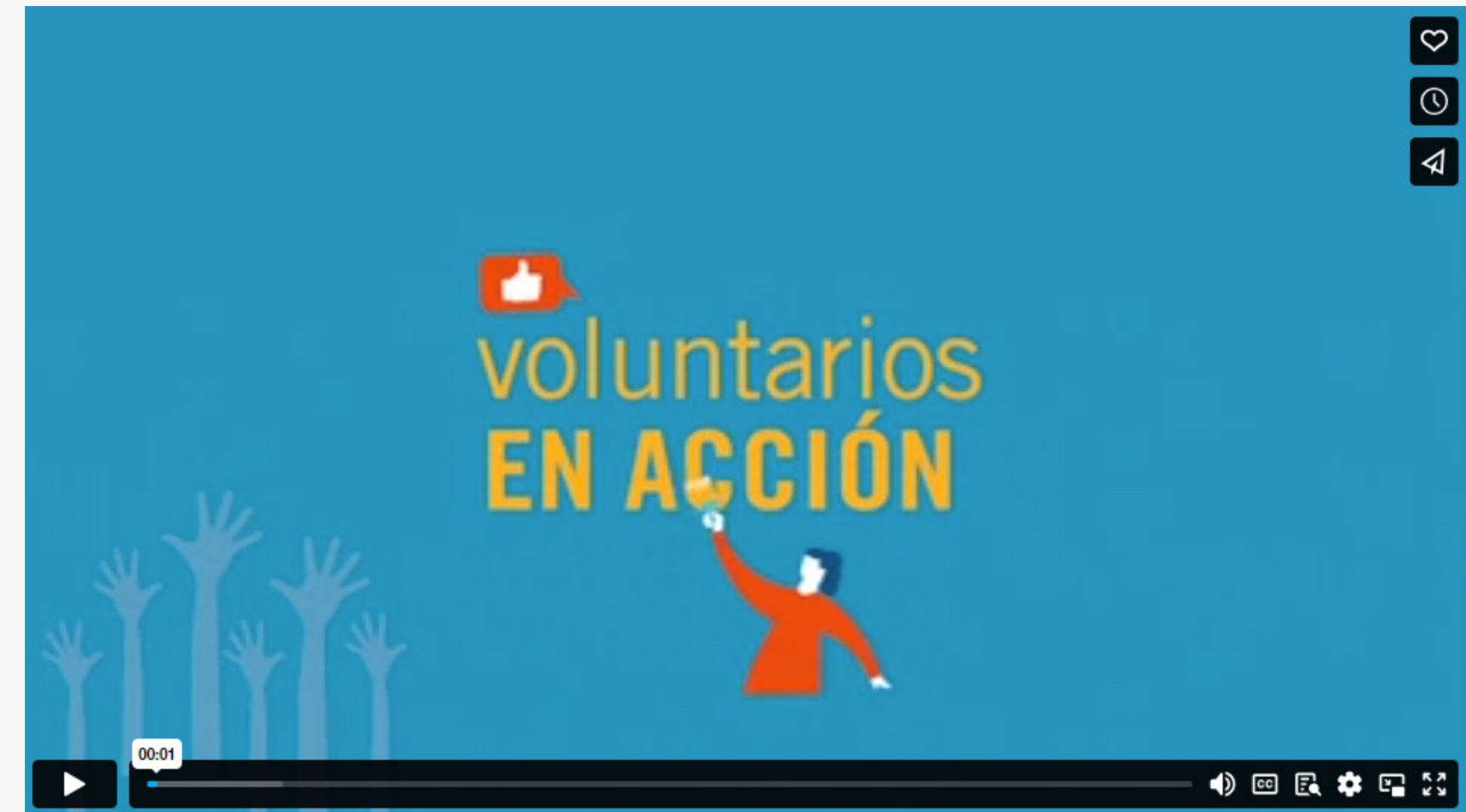
Voluntarios en Acción Escuela N 14 - Conesa (Video)