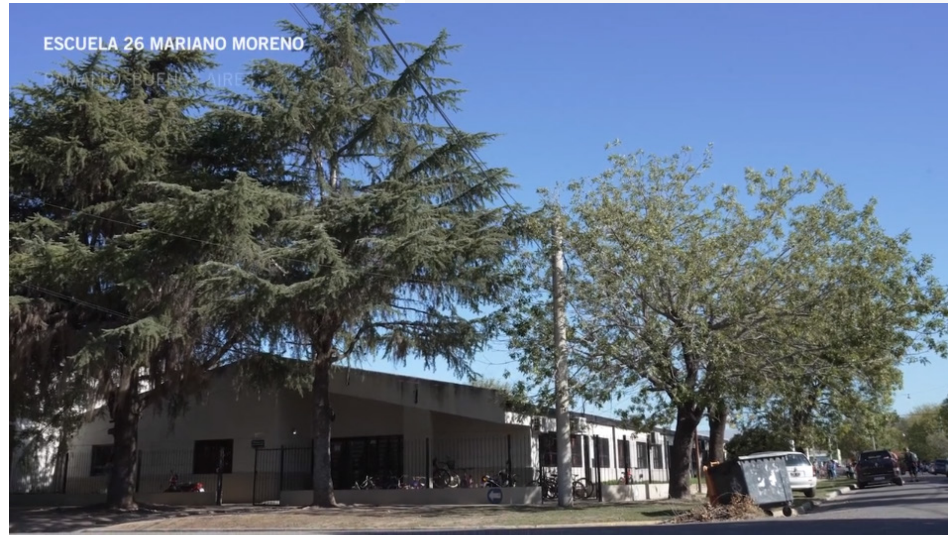
Voluntariado Ternium EP N° 26 Ramallo (Video)