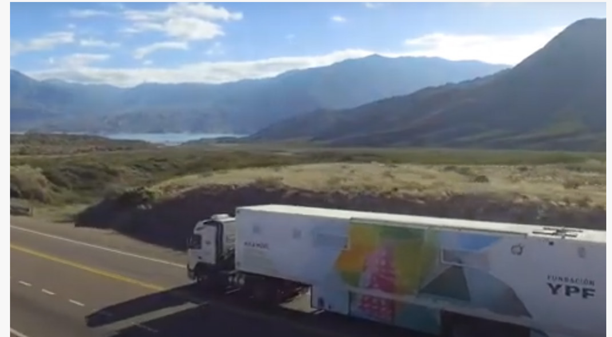
Testimonios e implementación (Video)