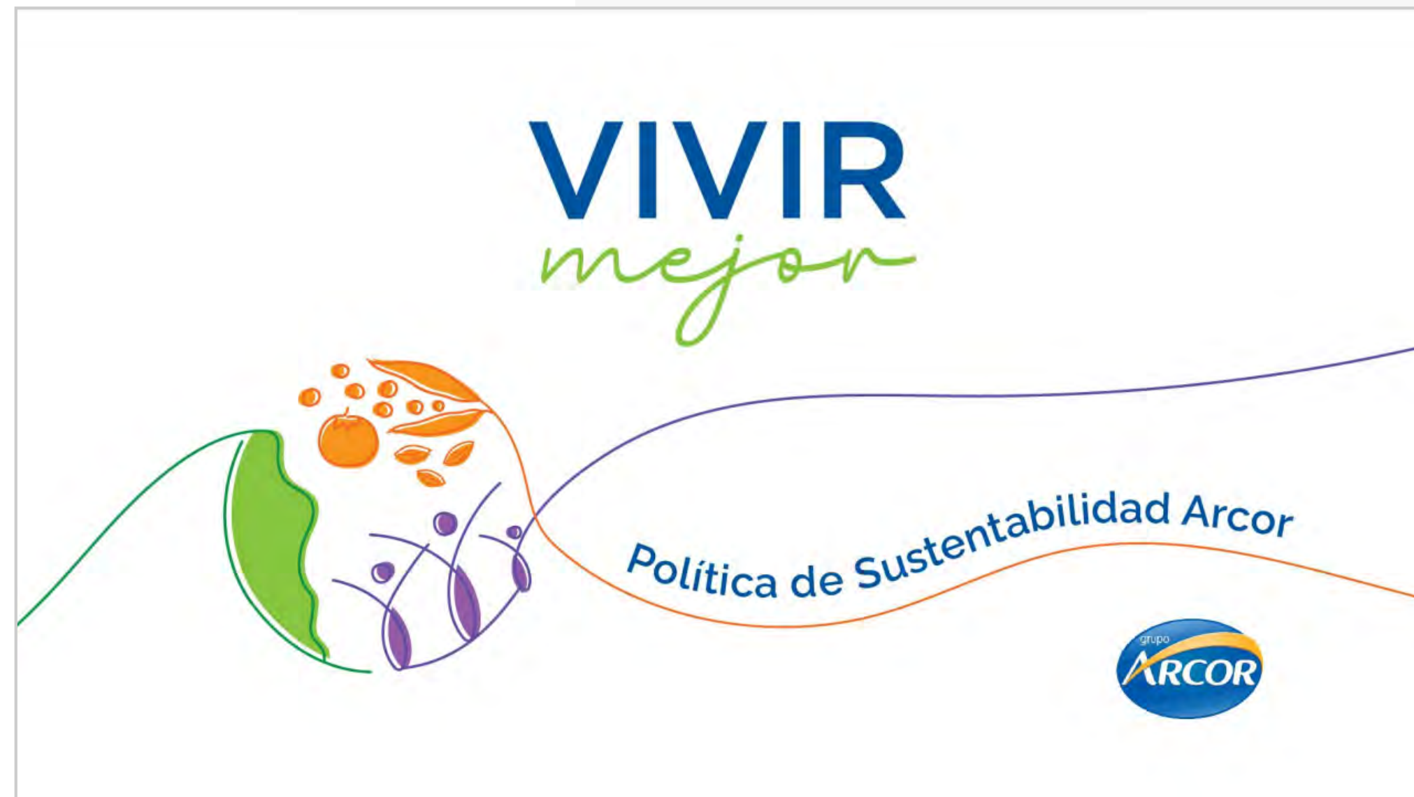
Política de Sustentabilidad (Archivo PDF)