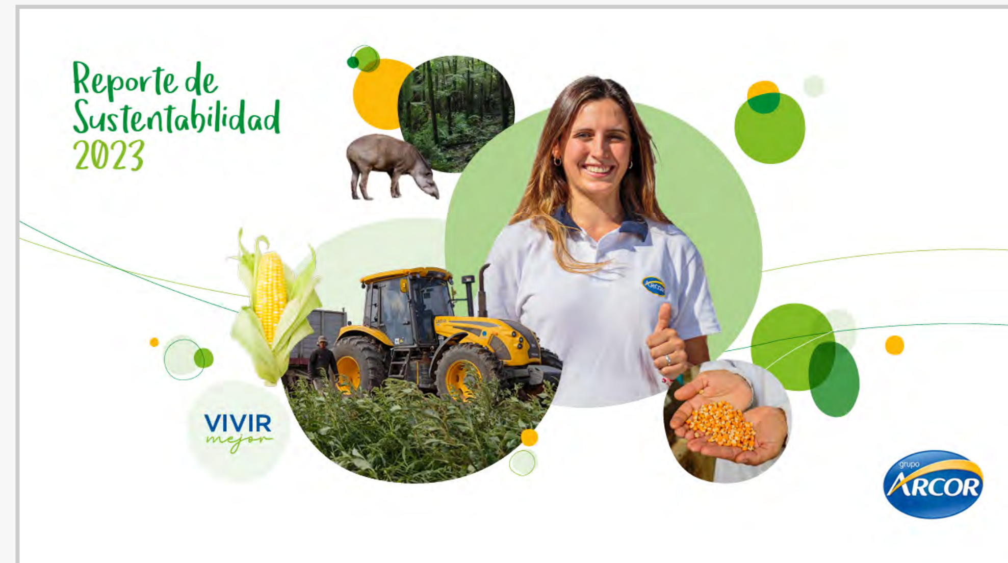
Reporte 2023 (Link PDF)