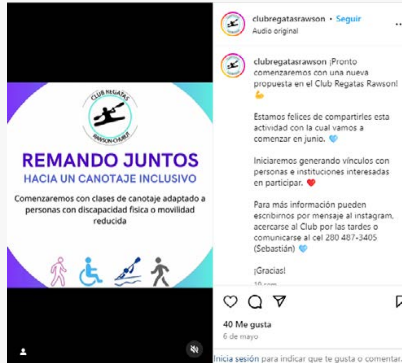
Proyecto Remando Juntos (Link IG)